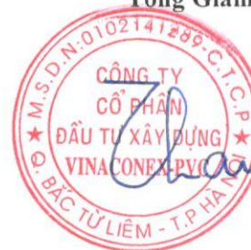
Vũ Thành Kiên