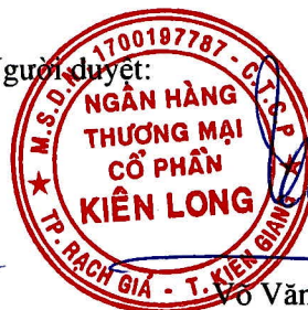
Võ Văn Châu Người đại diện theo pháp luật

Các thuyết minh đính kèm là bộ phận hợp thành của báo cáo tài chính hợp nhất giữa niên độ này