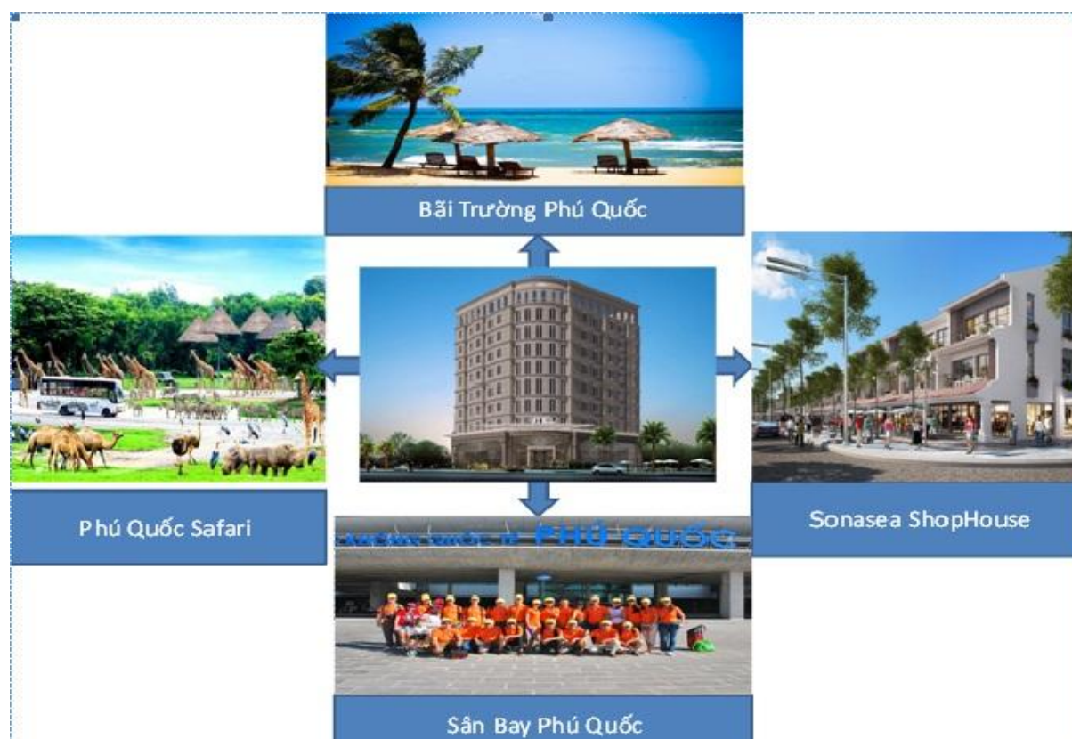
(Dự án Khách sạn DTC của Công ty cổ phần Đầu tư Đức Trung tại Bãi Trường, Dương Tơ, Phú Quốc, Kiên Giang)

Hiện tại DTC đã ký hợp đồng với nhà thầu khoan thăm dò địa chất và nhà thầu thiết kế, giám sát thi công xây dựng khách sạn. Dự kiến tiến độ xây dựng trong quý III và quý IV/ 2017 về cơ bản sẽ xong được hạ tầng..... Dự kiến quý III/2018 khách sạn sẽ đi vào hoạt động và bắt đầu sử dụng khai thác.