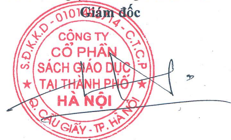
Cần Hữu Hải