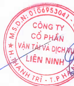
Ngô Xuân Phú