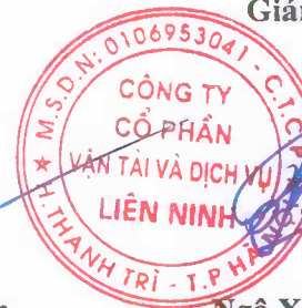
Ngô Xuân Phú