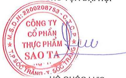
HỒ QUỐC LỰC