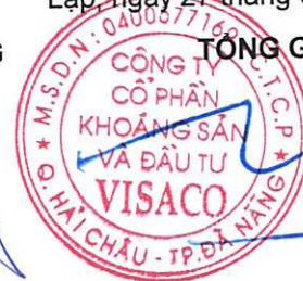
Trương Thế Tùng