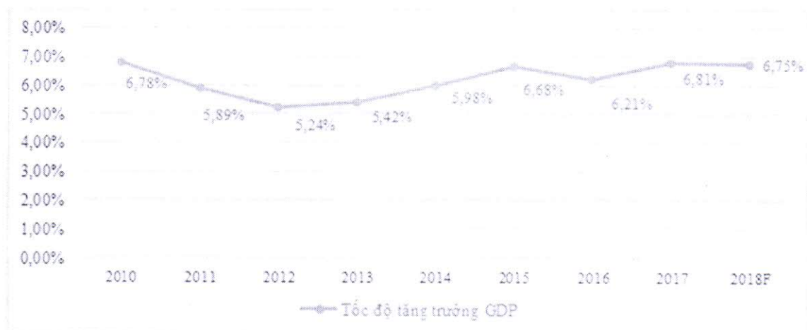
Hình 1: Tốc độ tăng trưởng GDP của Việt Nam qua các năm