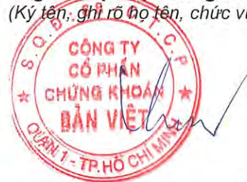
ĐINH QUANG HOÀN

(Ký tên, ghi rõ họ tên, chức vụ, đóng dấu)