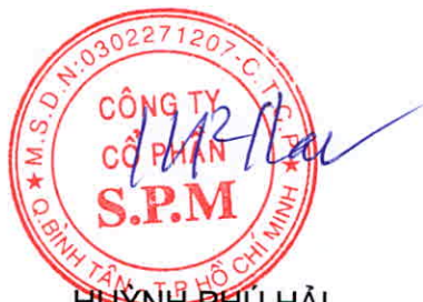
HUỲNH PHÚ HẢI Phó chủ tịch HĐQT