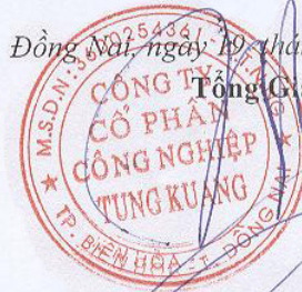
Lưu Chiến Hưng