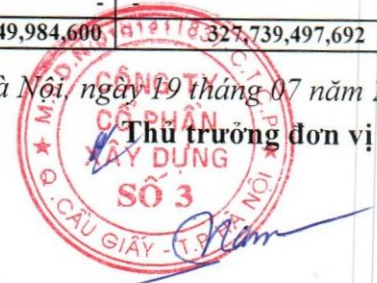
Kiều Xuân Nam