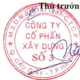
Kiều Xuân Nam