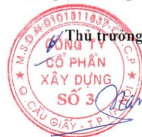
Kiều Xuân Nam