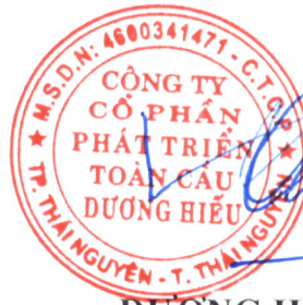
DƯƠNG HỮU HIẾU