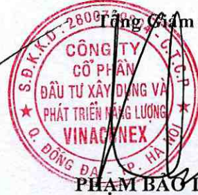
PHẠM BẢO LONG