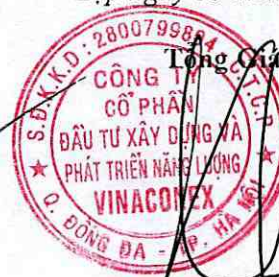
PHẠM BẢO LONG