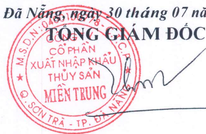
Trần Như Thiên Mỹ