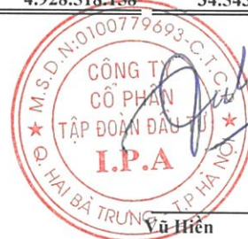
Vũ Hiền Chủ tịch Hội đồng quản trị Hà Nội, ngày 27 tháng 07 năm 2018