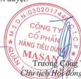
Trương Công Thắng Chủ tịch Hội đồng Quản trị