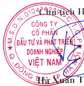
Hà Xuân Trường