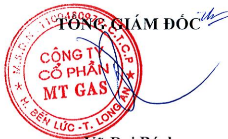
Vũ Đại Bách