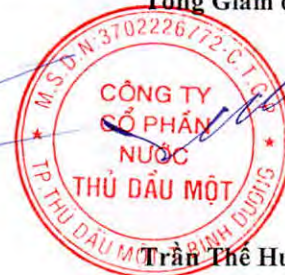
Trần Thế Hưng