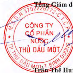
Trần Thế Hưng