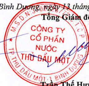
Trần Thế Hưng