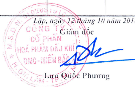
Lưu Quốc Phương