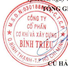
CÙ HẢI LONG