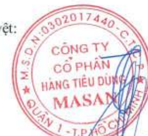
Trương Công Thắng Chủ tịch Hội đồng Quản trị

Các thuyết minh đính kèm là bộ phận hợp thành của báo cáo tài chính hợp nhất này