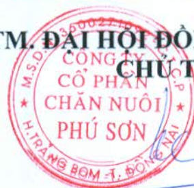
Phùng Khôi Phục