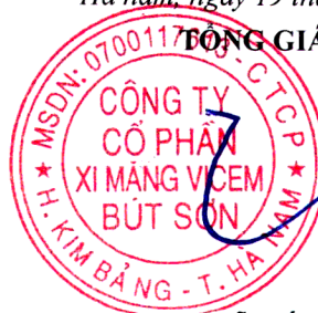
Đỗ Tiến Trinh