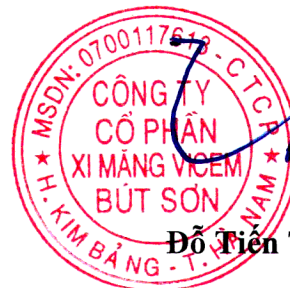
Đỗ Tiên Trình