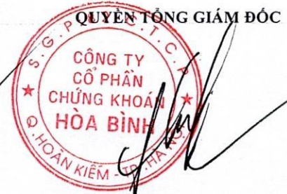
Trần Kiên Cường