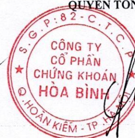
Trần Kiên Cường