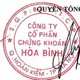
Trần Kiên Cường