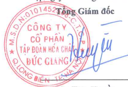
Đào Hữu Huyền