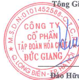
Đào Hữu Huyền