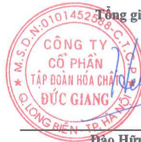
Đào Hữu Huyền