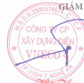
Hồ Hữu Phước