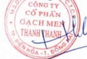
Trần Hưng Lương