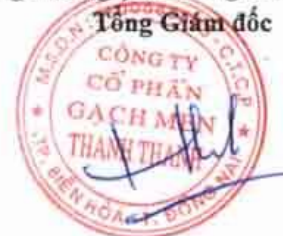
Trần Hưng Lương